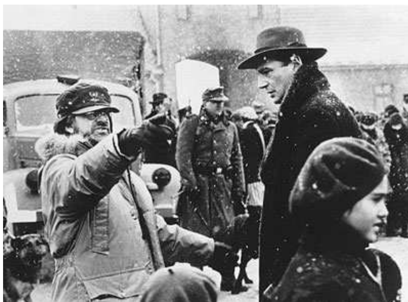
La lista de Spielberg

Y vaya que si impacta esta necesaria película en la que sus tres horas no pueden dejar indiferentes a nadie. Por momentos nos avergüenza de nuestra propia raza al mostrarnos mejor que cualquier otro documento la sinrazón del nazismo, al que le dio por los judíos como pudo darle por otros... pero también nos enorgullece por personas como ese Oskar Schindler cuyos restos descansan en Jerusalén, donde también hay un árbol plantado en su honor en la Avenida de los Justos... y también nos brinda este pelicolón el, en mi opinión, más bello final de la historia del cine.