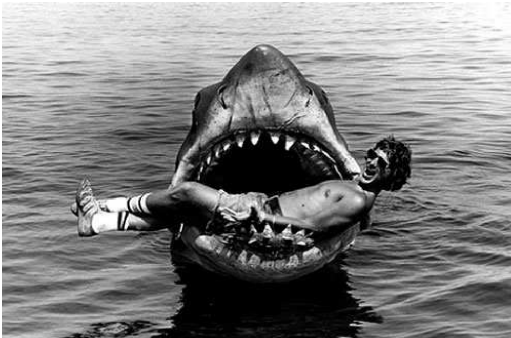
Spielberg con su "Tiburón" aparentemente domesticado

En 1977 dirigiría su propio guión de "Encuentros en la tercera fase"; una película que no se cuenta entre las mejores, a pesar de ser su primera nominación a los Oscar como mejor director, pero que aprovechó comercialmente la fiebre OVNI de la época.